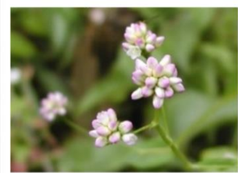
アキノウナギツカミ