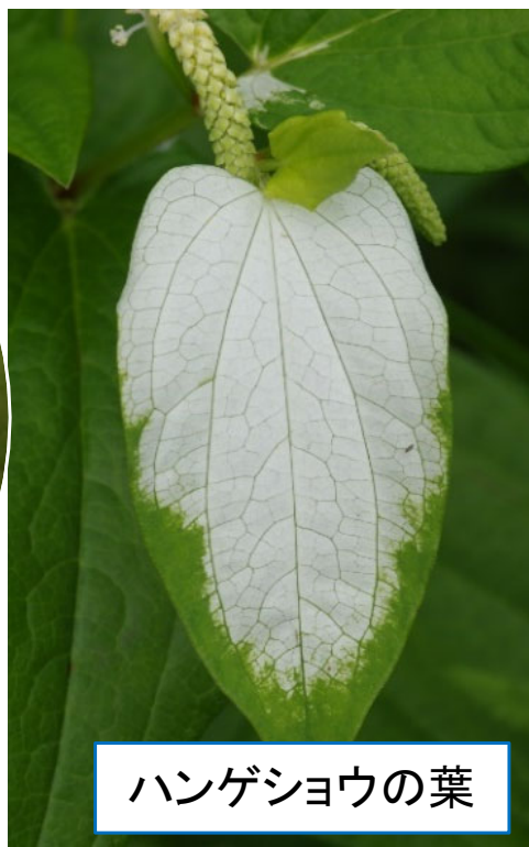
ハンゲシヨウの葉