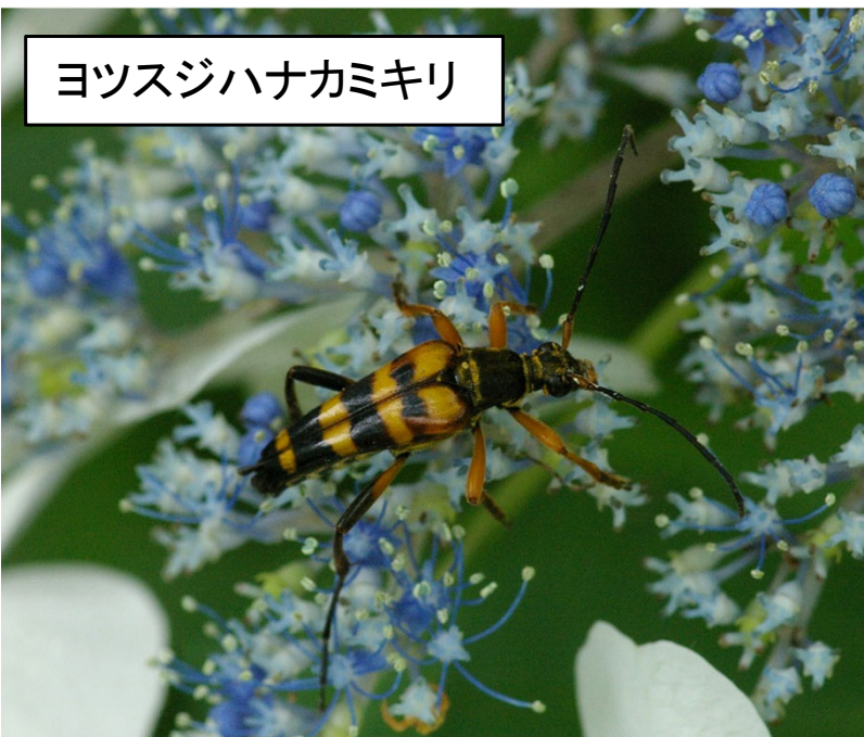
ヨツスジハナカミキリ

ガクアジサイやエゾアジサイでは、花粉や花の蜜を食べるヨツスジハナカミキリが集まる。黒と黄色の模様でハチに似せて身を守っているとされる。